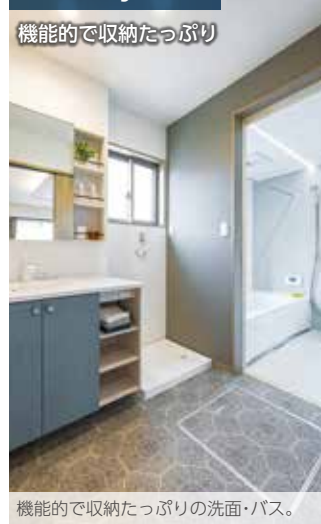
機能的で収納たっぷりの洗面・バス。