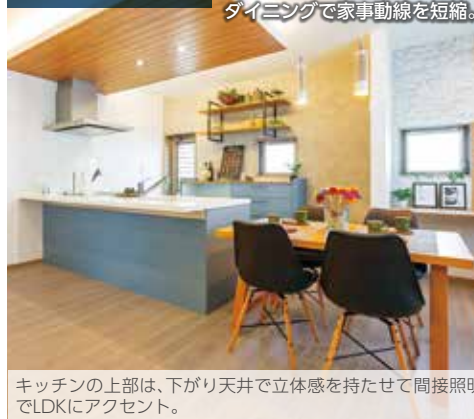
キッチンの上部は、下がり天井で立体感を持たせて間接照明でLDKにアクセント。