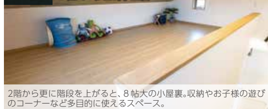
2階から更に階段を上がると、8帖大の小屋裏。収納やお子様の遊びのコーナーなど多目的に使えるスペース。