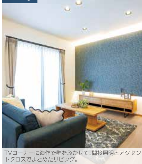
TVコーナーに造作で壁をふかして、間接照明とアクセントクロスでまとめたリビング。