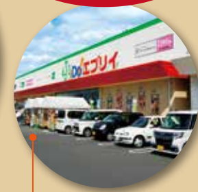
エブリイ 高松レインボー店 徒歩9分(720m)