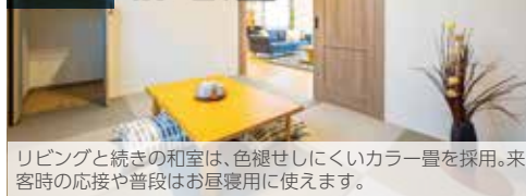
リビングと続きの和室は、色褪せしにくいカラー畳を採用。来客時の応接や普段はお昼寝用に使えます。