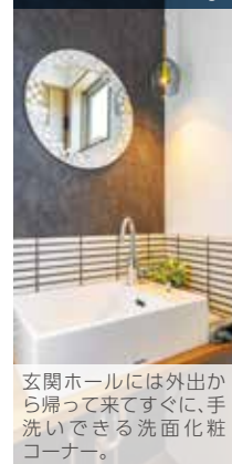
玄関ホールには外出から帰って来てすぐに、手洗いで済む洗面化粧コーナー。