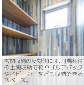
玄関収納の反対側には、可動棚付の土間収納で靴やゴルフバッグやベビーカーなども収納できるスペース。