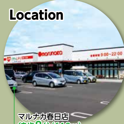
マルナカ春日店 徒歩8分(610m)