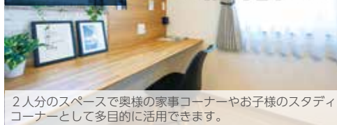
2人分のスペースで奥様の家事コーナーやお子様のスタディコーナーとして多目的に活用できます。