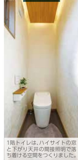
1階トイレは、ハイサイトの窓と下がり天井の間接照明で落ち着ける空間をつくりました。