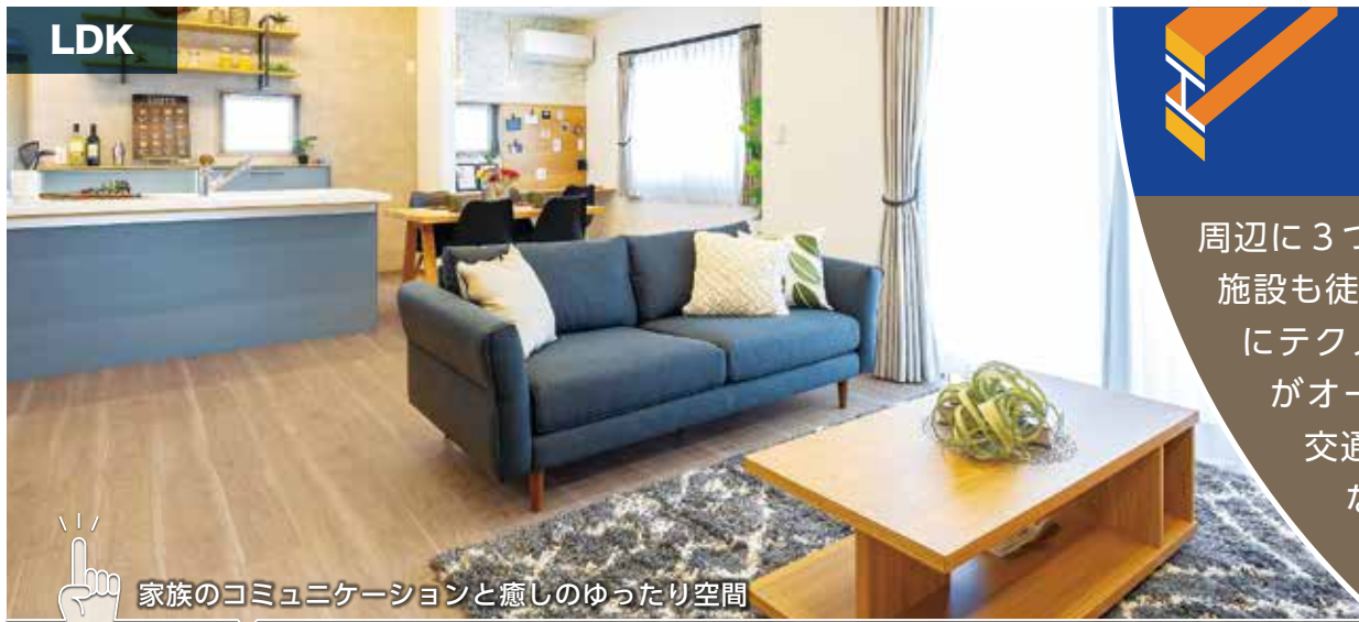
家族のコミュニケーションと癒しのゆったり空間

ホールからリビングドアを開けると対角線に視野が広がる20.5帖のLDKが、帖数以上の空間を演出し、リビングに続く6帖の和室がさらに広がりをつくりだしています。