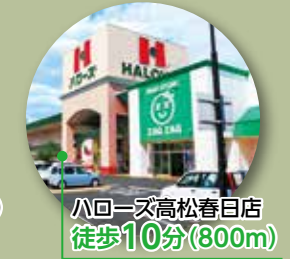
ハローズ高松春日店 徒歩10分(800m)