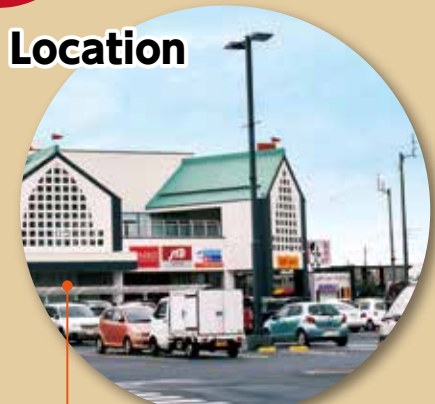
パワーシティレインボー店 徒歩10分(800m)