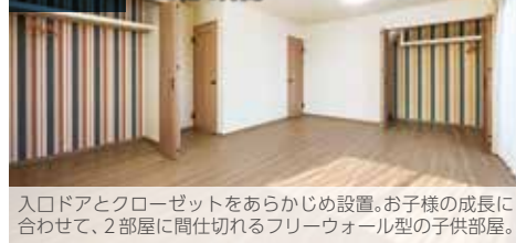
入口ドアとクローゼットをあらかじめ設置。お子様の成長に合わせて、2部屋に間仕切れるフリーウォール型の子供部屋。