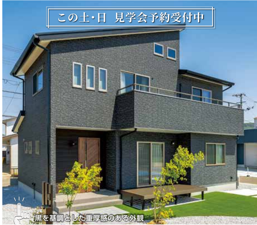
黒を基調とした重厚感のある外観

敷地の3方が道路で、お隣に気を使うことなく生活できる立地です。セラミックコートと光触媒コートで、色落ちしにくく、雨で汚れを強力に洗い流す素材の外壁を採用していますので、美しい外観が長期間続きます。