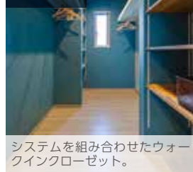
システムを組み合わせたウォークインクローゼット。