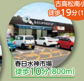
春日水神市場 徒歩10分(800m)